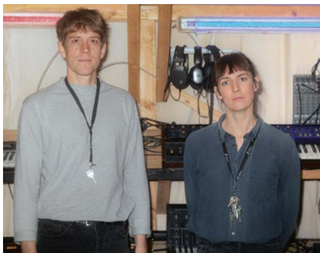
Les Trucs, DJ-Set