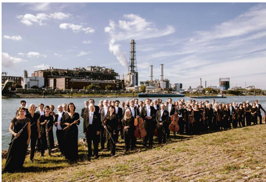
Deutsche Staatsphilharmonie Rheinland-Pfalz