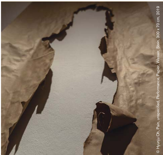
© Hyunju Oh, Pain, unspecified, Performance, Papier, Wasser, Stein, 300 x 70 cm, 2019