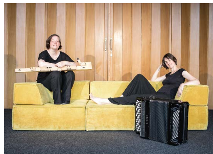
Windspiel - Duo für Neue Musik