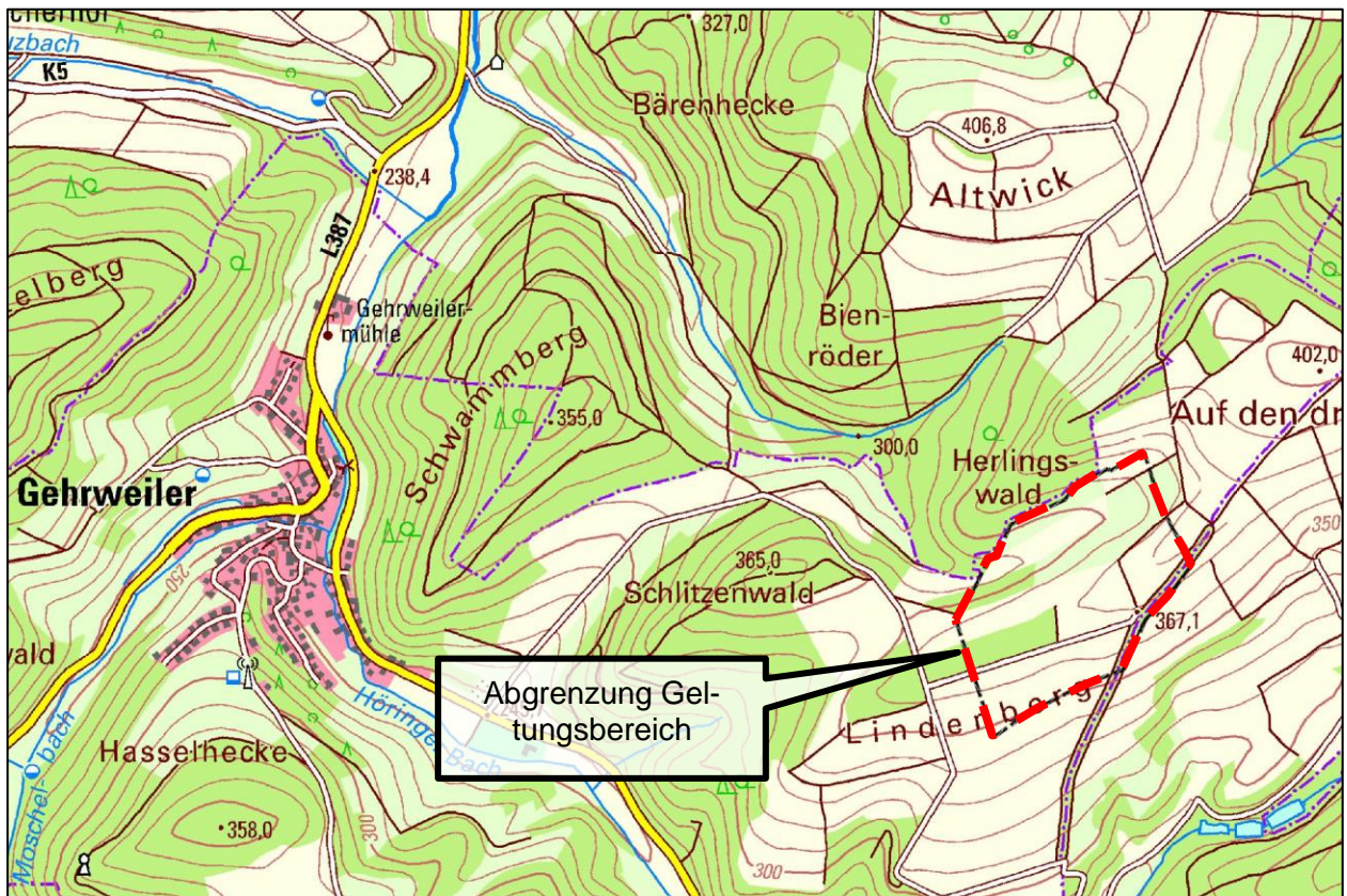
Abb. 1: Geltungsbereich Bebauungsplan „Lindenberg“ im näheren räumlichen Zusammenhang