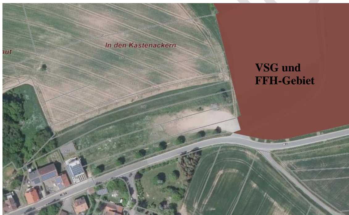
Abbildung 2: Abgrenzung VSG und FFH Gebiet (Auszug aus LANIS RLP , Februar 2023)

Auswirkungen des Bebauungsplanes auf die Schutzgebiete und deren Schutzzwecke sind nicht zu erwarten.